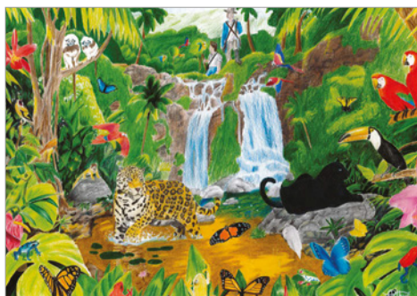
Illustration d'Arthur, lauréat sur le niveau CM2-6 e