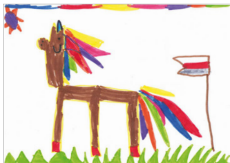
Illustration d'Amalia, lauréate sur le niveau maternelle

Attention , il est important de lire le règlement scrupuleusement afin que nous puissions prendre en compte les dessins des jeunes participants.